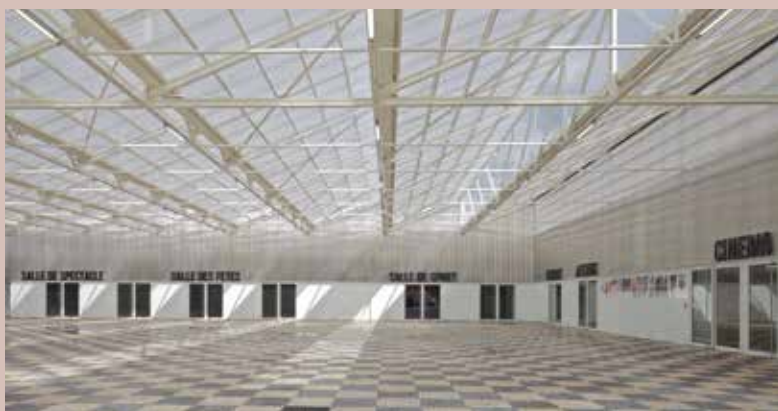
L'espace Monesté, complexe culturel à Plaisance-du-Touch, Haute-Garonne, PPA Architecture avec Taillandier architectes associés