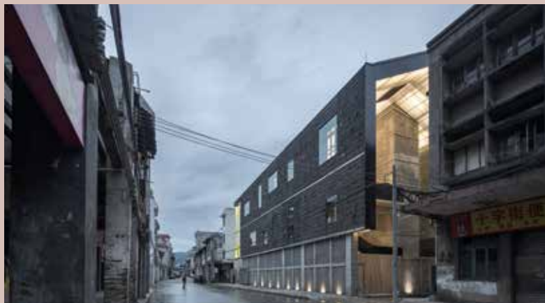
Le Musée de la Photographie de Lianzhou, province du Guangdong, O-Office architects, 2017