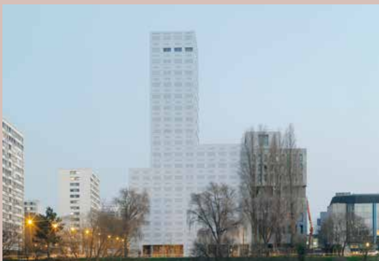
La tour 360° View dans le futur quartier Polaris, île de Nantes, LAN architectes