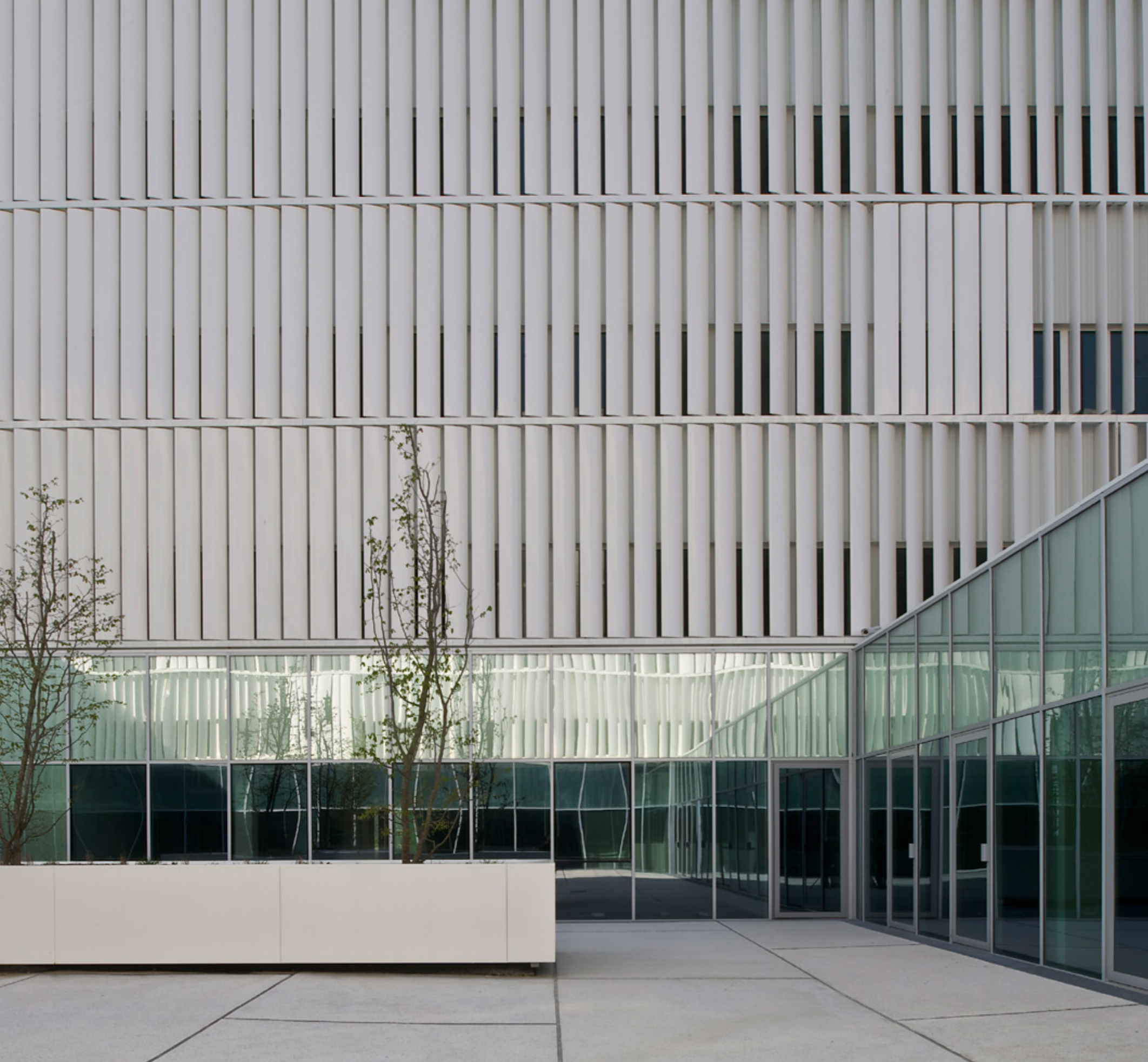
Bureaux Cap Constellation